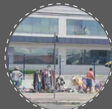
Brechós de rua ao longo da SC 403

Estes dois espaços abrigarão uma prática já existente no bairro: os brechós de rua que acontecem ao longo da SC 403. Ao trazer para dentro do prédio a feira os usuários poderiam adquirir as roupas nos brechós e realizar os reparos necessários nas peças dentro do próprio edifício. Estimulando um consumo inteligente e conscientizando acerca da reciclagem e da reutilização (também no programa de usos e não apenas na arquitetura).