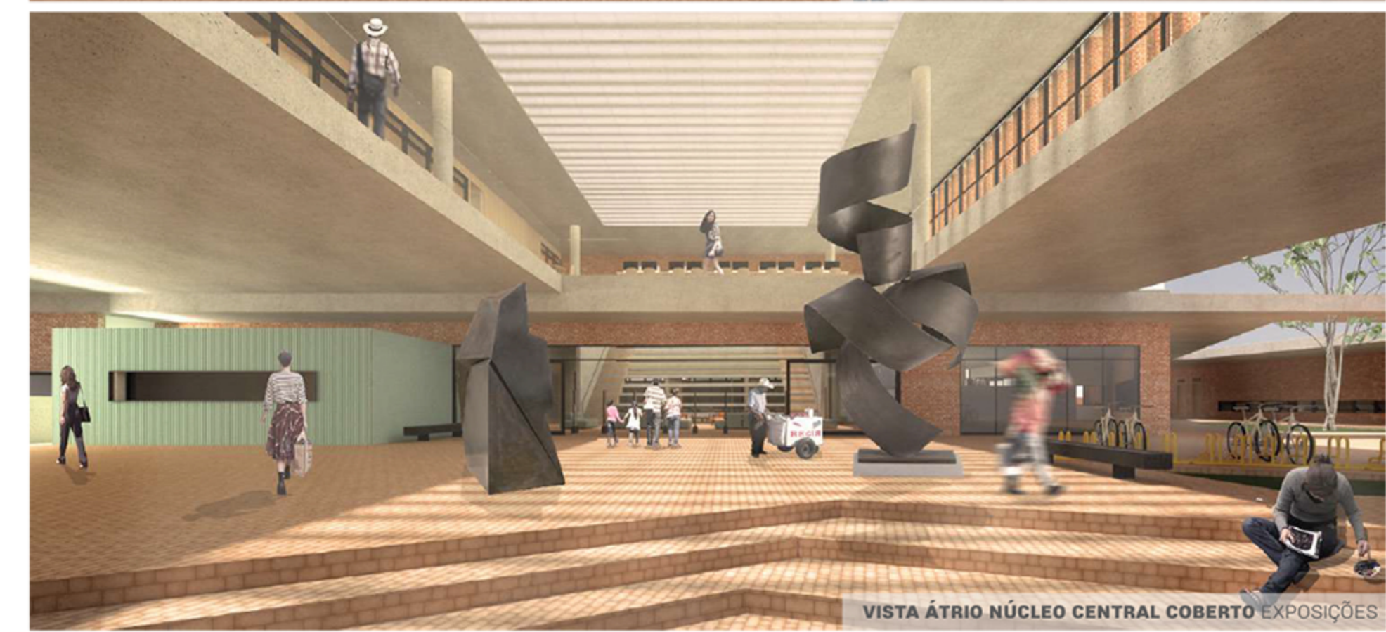
VISTA ÁTRIO NÚCLEO CENTRAL COBERTO EXPOSIÇÕES