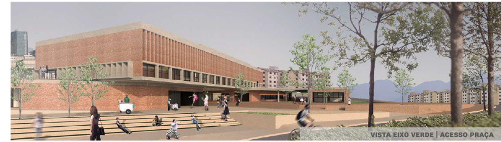
VISTA EIXO VERDE | ACESSO PRAÇA