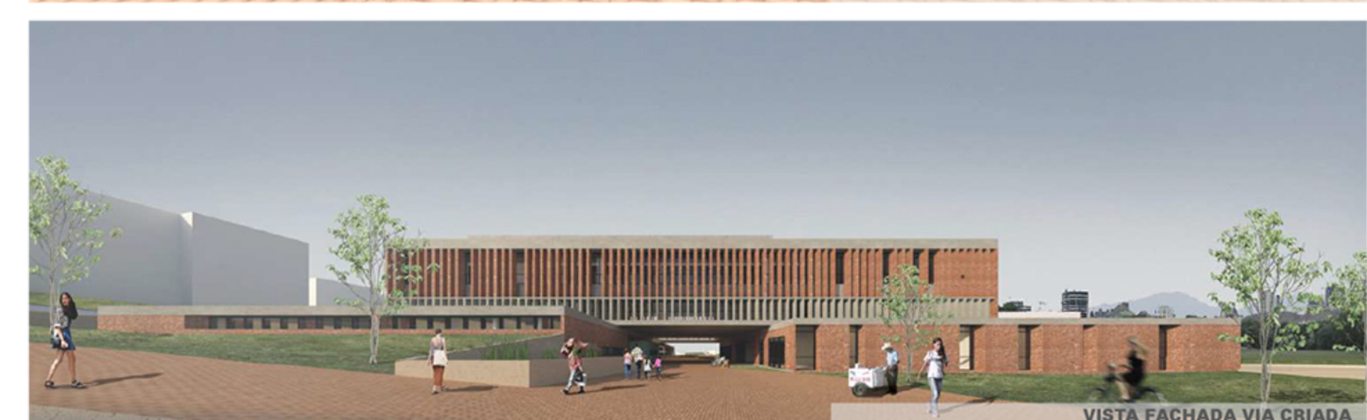
VISTA FACHADA VIA CRIADA