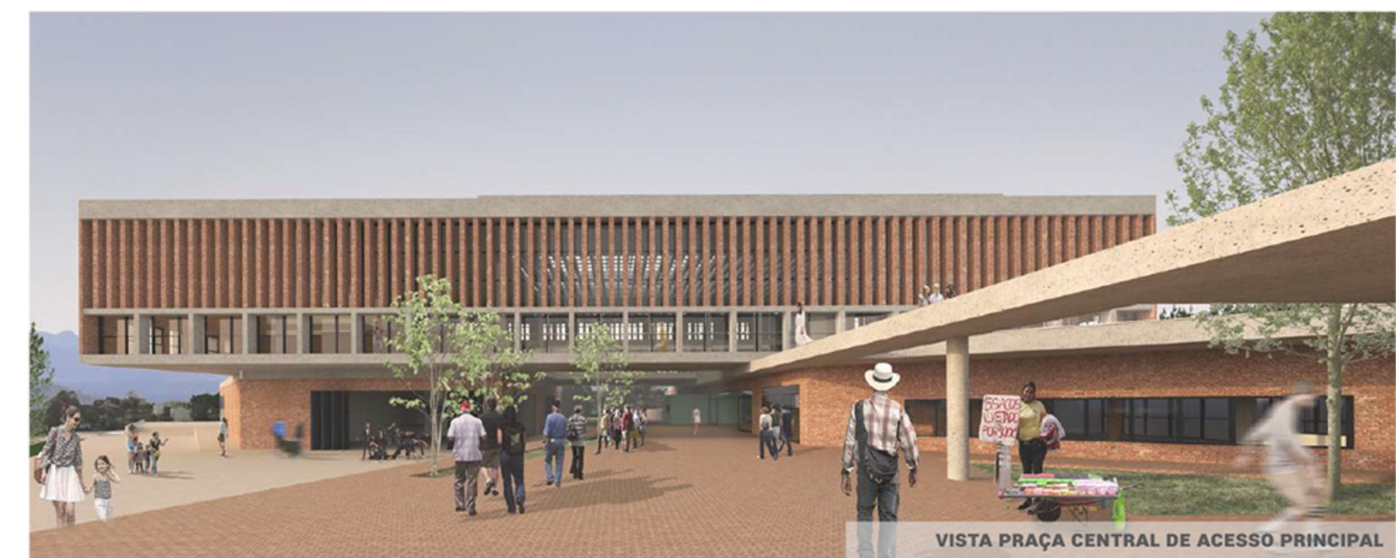
VISTA PRAÇA CENTRAL DE ACESSO PRINCIPAL