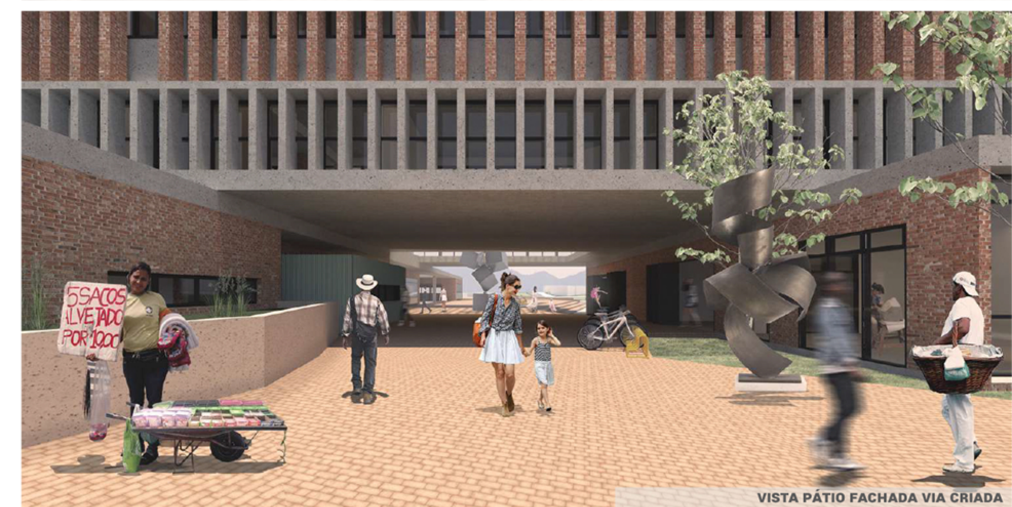
VISTA PÁTIO FACHADA VIA CRIADA