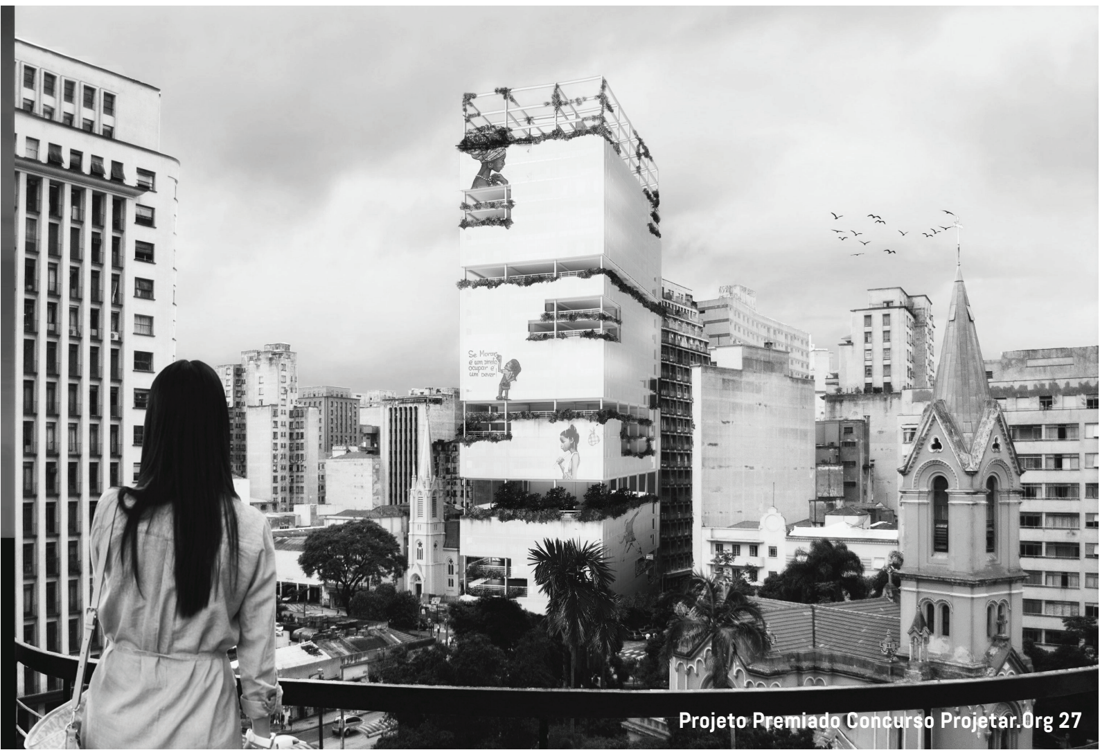
Projeto Premiado Concurso Projetar.Org 27