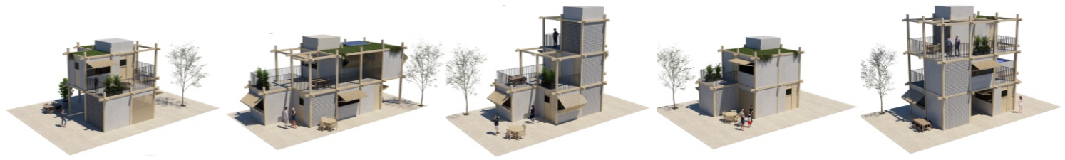
SIMULAÇÃO DE POSSÍVEIS CONFIGURAÇÕES QUE AS UNIDADES PODEM ASSUMIR

CONCURSO PÚBLICO NACIONAL DE PROJETOS DE ARQUITETURA EM HABITAÇÃO DE INTERESSE SOCIAL